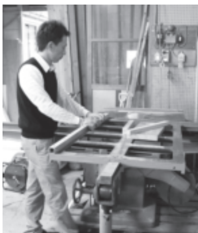
木材を同じサイズに切るのに欠かせない「木工横切り傾斜盤」。フル稼働で復興需要に応えている。

そして、最後に「津波が襲って来た時、私はたまたま作業所を離れていて難を逃れました。しかし、奥さんや子どもさん、命ある限り、この仕事を続け、お客さまの信用に伝えていかなければならないと思うのです。私が言うのもおこがましいのですが、一人で考え、迷っている間に動きがとれなくなることもあります。工作機械を失い、困っている経営者の方は、まず商工会議所に連絡を入れてみることをお勧めしたいです。せっかくだ腕を持ち、いいものを提供しているのなら、なおさらです。そしてお互いがんばりましょう」と話してくれました。