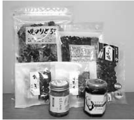
当社が扱う被災企業の海産物。現在、国内向けにネットでの販売もしています。

将来的には、タイだけでなくアジアや欧米など多くの国に東北の地場産品を販売できるように輸出先を増やしていきたいです。