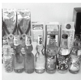
地元名産品の活用をコンセプトとした多くの商品を開発

自社では経験できない貴重な体験もできますし、入会してからは表情が明るくなったとよく