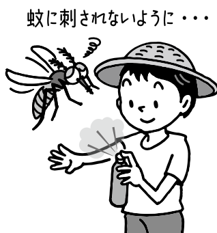
蚊に刺されないように・・・

8月のリオは冬だから、蚊の心配は要らない？いやいや、リオの気温は冬でも20℃を越しますから、蚊の活動も活発です。特に妊婦が感染すると、胎児が小頭症となるリスクも指摘されています。で、厚生労働省は「妊婦および妊娠予定の婦人の流行地への渡航は可能な限り控える」よう勧告しています。