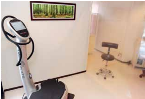
フィットネスルームの様子。直接触れる部分の消毒のほか、インストラクターとの間にビニールカーテンを設置し、お客さまの安全・安心を確保している。

フィットネスメニューでは、部屋の消毒はもちろん、お客さまが直接触れる部分からの感染拡大を防ぐために、床をカーペットからフローリングに張り替え、トレーニング中は、マスクと使い捨てゴム手袋の着用をお願いします。また、