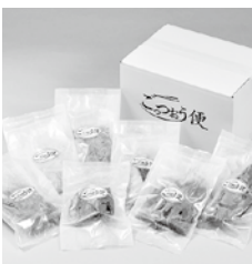
商品内容は固定化せずに、飽 きが来ない工夫を心掛けてい る。

立ち上げに向けては、「高級 料理ではなく昔からふるりに 根付いた『ごっつおう（ごちそ う）を手軽に』をコンセプト にしました。そして、地元産 の調理済みの魚や鶏肉、付け 合わせの副菜を真空冷凍パッ クにし、自然解凍で手軽に食 べられる商品づくりを目指し