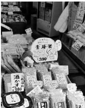
店頭で販売している商品の一部。5種類の雑穀をブレンドした「素朴米」は仙台朝市店限定商品。

地域に根差した販売店を目指して 当社は、おかげさまで10月に法人設立から10周年を迎えます。地域に根差した販売店を目指し、仙台朝市商店街と連携した「みそ作り講座」を開催するなど、住民と一緒に活動にも積極的に取り組んできたことが、多くの皆さまに支えていただけている秘訣だと感じています。今後も商品レイアウト等に工夫を凝らし、多くのお客さまに「豆・雑穀」の魅力に触れていただけるようなお店作りを行ってまいります。