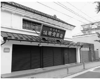
1912年(大正元年)に建てられた土蔵造りの店舗家屋「旧仙南堂薬店」。桃の節句の時期にはひな祭り関連のイベント会場になる。

当商店街は、もともと藩政時代から仙台藩の南の玄関口として発展し、青果市場のあったエリアに位置しています。ご近所同士のコミュニケーションや買い物の利便性といった暮らしやすさなど、現在も下町のような雰囲気が残る街ですが、最近では商業ビルやマンションも増え始め、飲食、理美容といったサービス業の新規出店や転勤族の方の転入なども多く、新しい流れができています。