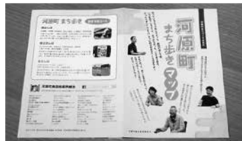
2017年に作製した「河原町まち歩きマップ」。各歴史的建造物や商店街に位置する飲食店のほか、まち歩きのおすすめコースも掲載されている。

年間の主な催し・イベント 河原町夏祭り (8月第1日曜日開催) 広瀬川灯ろう流し (8月20日開催) 年末大売り出し (12月開催)