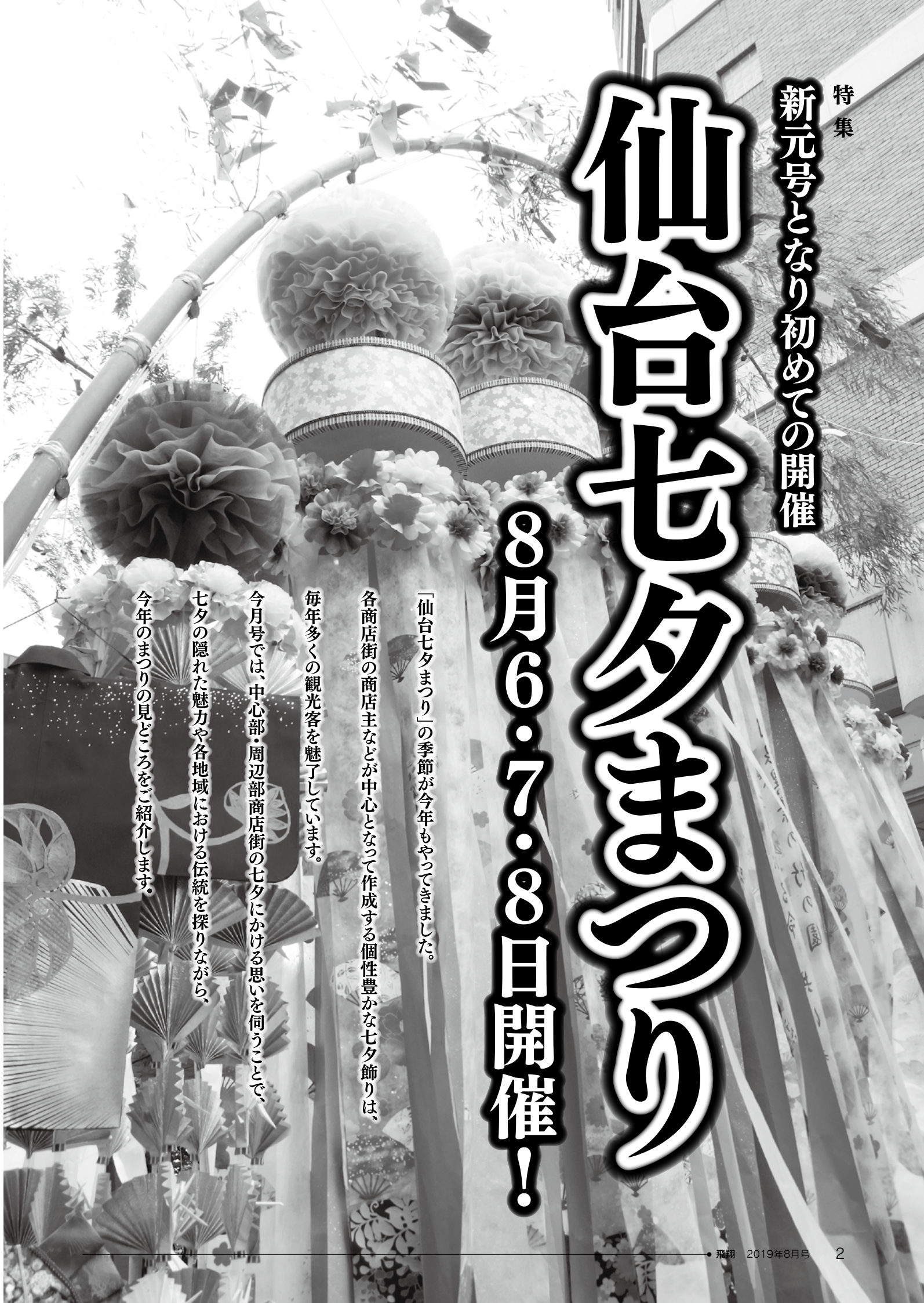
商店街が取り組む仙台七夕①