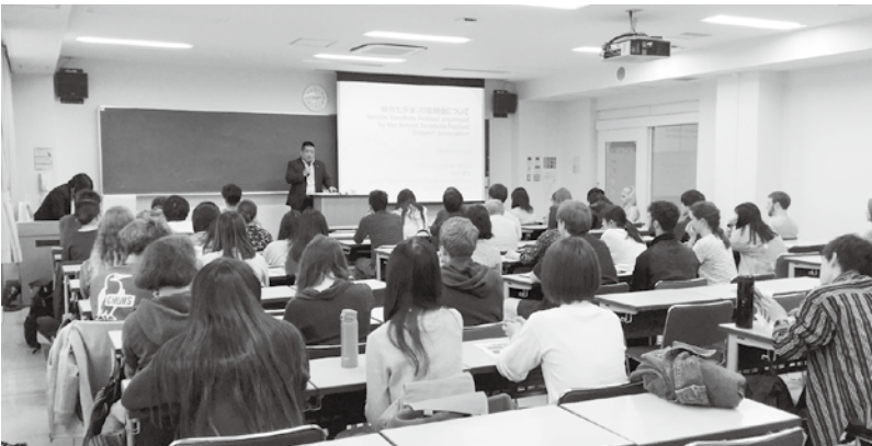
当日の授業での1コマ。留学生たちが熱心に耳を傾ける様子から、日本文化への理解を深めたいとの思いが感じられた。

毎年、国内外から200万人が訪れる仙台七夕まつり。今後も、留学生を含めた海外の皆さまにさまざまなチャネルを通じてPRしていきます。