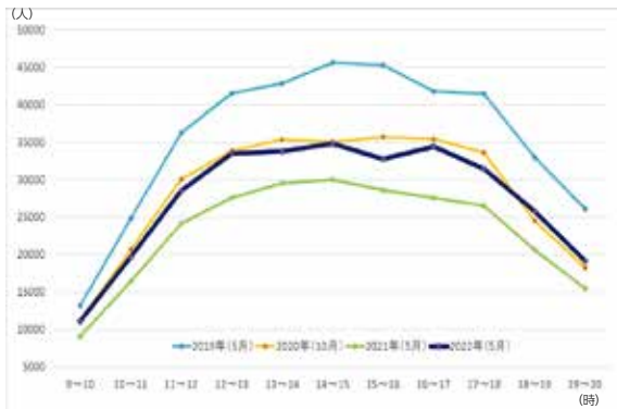
【図4】時間帯別通行量の推移(日曜日)

※本調査結果の詳細は当所ホームページに掲載していますので、ぜひご覧ください。 お問い合わせは、当所地域づくり推進グループ (TEL 265-8184) まで。