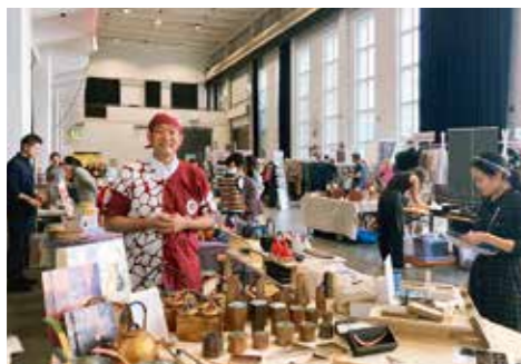
海外での展覧の様子