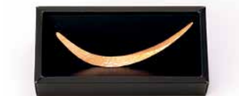
銅製ペーパーナイフ