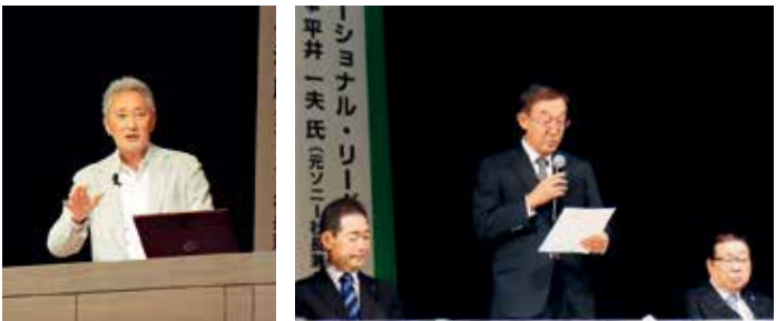
(写真上段) 10月7日に開催した全部会合同総会には約500人が出席。 (写真下段・右) 各部会で銓衡した2号議員を、各部会長や銓衡委員から発表。 (写真下段・左) 全部会合同総会に合わせて、プロジェクト希望(元ソニー社長兼CEO)の平井一夫代表理事を講師に招き、「変革をもたらす モチベーション・リーダーシップ」と題した記念講演会を開催。