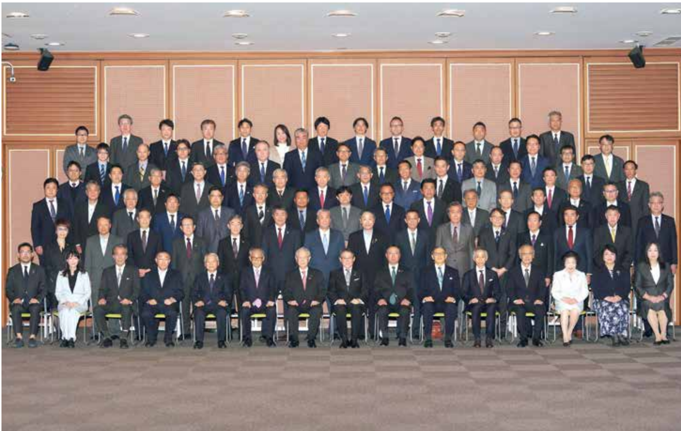
11月4日、臨時議員総会後に撮影した新議員の集合写真(当日出席者のみ)。