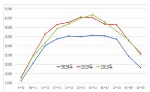
図4. 時間帯別通行量の推移（日曜日）

本調査結果は当所ホームページにも掲載していますので、ぜひご覧ください。(https://www.sendaicci.or.jp/)。 お問い合わせは、当所地域づくり推進グループ (Tel.265-8184) まで。