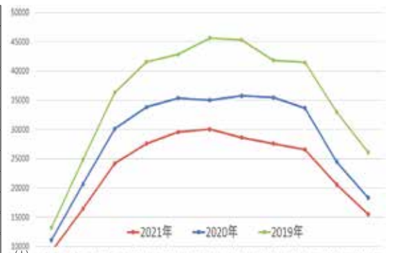
図4. 時間帯別通行量の推移(日曜日)

※本調査結果は当所ホームページにも掲載していますので、ぜひご覧ください。 お問い合わせは、当所地域づくり推進グループ(TEL.265-8184)まで。