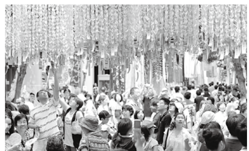
昨年飾られた市内全児童生徒8万人の七夕飾り