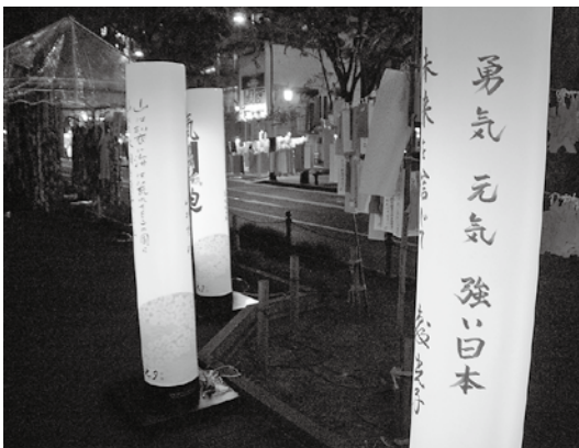
復興への願いをこめて、昨年定禅寺通りに設置された京都の円柱行灯。今年には宮城オリジナルバージョンが作成されます。

「ステージでは、今年も徳島の阿波踊りや博多どんたくのパフォーマンスが披露されますし、夕方からは吉本のお笑いステージもあり、一日中楽しめる要素を盛り込みました。中でも今回の目玉は『希望への道』に掲出される30基余りの行灯。行灯には、宮城にゆかりのある方々から寄せられた「希望のメッセージ」が書かれています。竹とLEDが織りなす幻想的なアーチをくぐりながら、約100メートルにわた