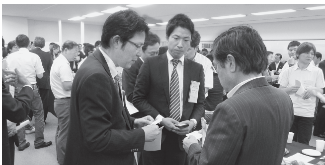
交流会には会頭・副会頭ら当所執行部も参加