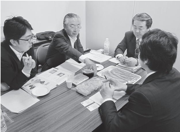
バイヤーが繰り出す具体的なアドバイスが 明日のヒット商品につながるかも。