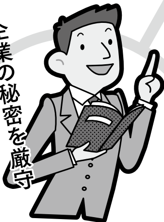
専門家 (エキスパート)