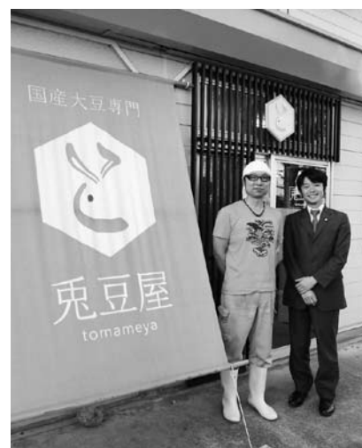
青葉区福沢町にある「兔豆屋」は、手づくりの豆 腐やがんも、湯葉などを販売する知る人ぞ知る 国産大豆専門店。