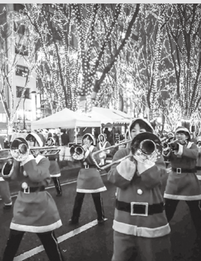
「サンタの森の物語」開始

※31日のみ24時まで。※毎日18時、19時、20時の3回、イルミネーションが一斉に消え再点灯する「スターライト・ウイंक」が行われます。