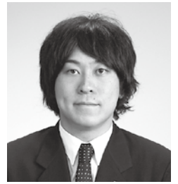
2015 SENDAI光のページェント 実行委員長