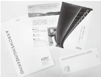
口ご作成から・封筒・会社案内まで一貫性を持ったデザインを提案しています。

「お客さまとエンドユーザーのコミュニケーションを円滑にするツール制作」が当社の仕事です。新たな感性を磨き、刺激を受けることを常に意識しながら、お客さまの会社の良さ、面白さを発信していきたいと思っています。