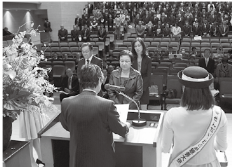
記念の盾を受け取る創業・創立記念会員事業所の代表者(今年2月)。

優良従業員表彰は、当所会員企業に20年以上勤続している従業員の皆さんを、仙台商工会議所会頭名で表彰するもの。10年ごとに、2回目、3回目…と表彰を受けられ、1回目表彰では当所会頭のほか仙台市長名で、また、30年以上勤続の方は日本商工会議所会頭名でも表彰します。