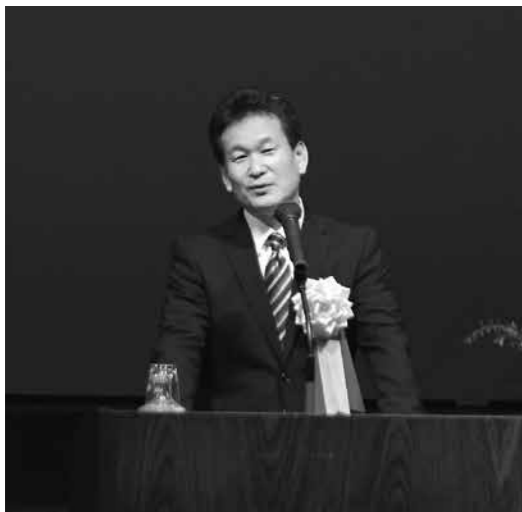
(右上) 10月5日に開催した全部会合同総会には750人が出席。