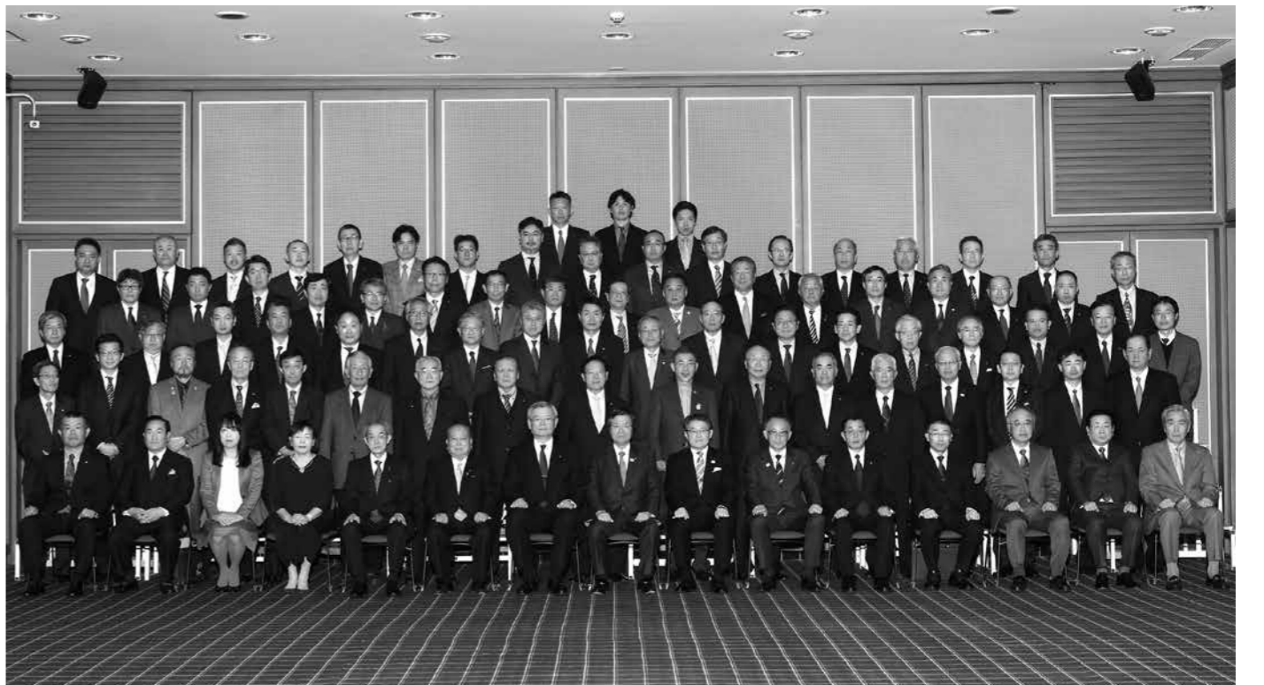
11月1日、臨時議員総会後に撮影した新議員の集合写真(当日出席者のみ)。