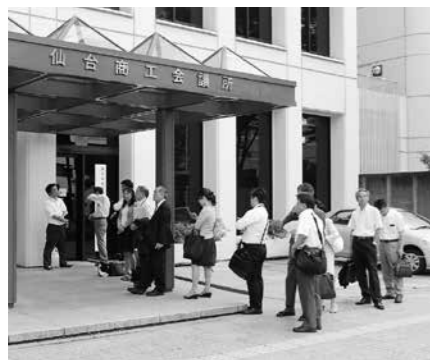
8月23日の1号議員立候補受付開始日には早朝から商工会議所会館前に列ができた。