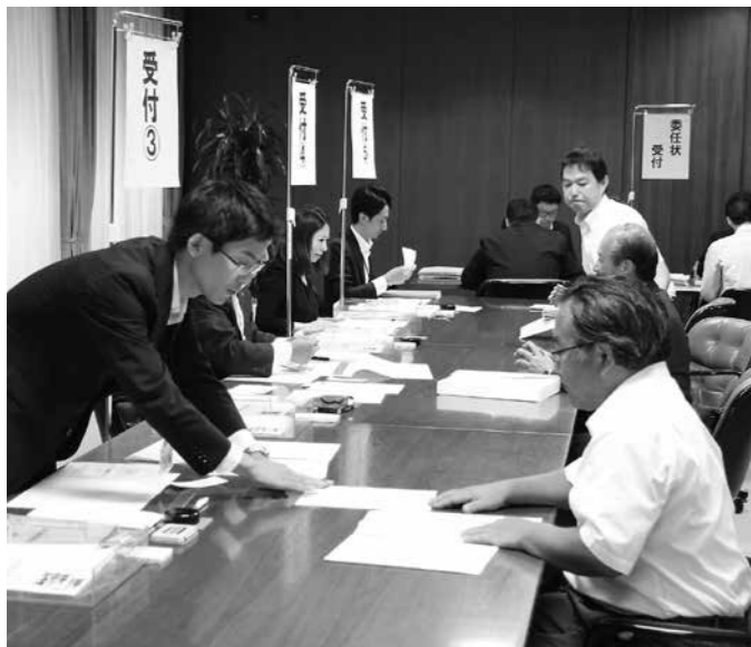
1号議員は、初日で約50人が立候補の手続きを行った。