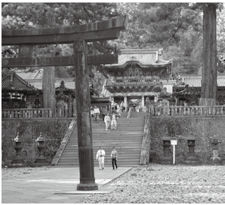
東照宮陽明門参道脇の伊達家献納鉄製灯籠(石段右側の2基)。石段左側は島津家献納銅製灯籠

長男秀宗（母は政宗側室）は、はじめ政宗の後継者とされていきました。秀宗は幼名を兵五郎といいますが、四歳にして豊臣秀吉の実質的な人質となり、秀吉の子・秀頼の家臣となります。六歳で秀吉の「秀」の一字をもらい秀宗と称し、従五位下侍従に叙任されます。これは秀吉が、秀宗を政宗