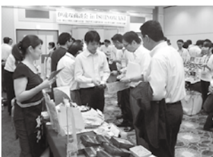
「伊達な商談会in ISHINOMAKI(平成28年8月)」では、管理栄養士としての実績を生かし、食材の美味しい食べ方についてパイヤーに提案する活動も。

地域が元気になるには、まずは、個々の企業が元気でなければならぬと思います。これからも、いろいろなサービスを利用しながら、商工会議所活動を通して、少しでも貢献していきたいですね。