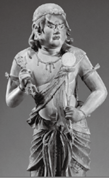
国宝 八大童子立像のうち 聖光童子像 運慶作 金剛寺蔵(後期展示)