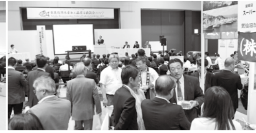
「伊達な商談会」等により引き続き販路開拓を支援する。写真は昨年6月に開催した「東北復興水産加工品展示商談会」の様子。今年は6月12、13日に開催。