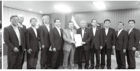
昨年7月に東北六県商工会議所連合会で行った吉野復興大臣への要望の様子。今年も、本格復興、地方創生の実現、中小企業の諸課題解決に向け、国・県・市へ経済界の声を届ける。