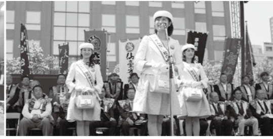
せんだい・杜の都親善大使の3人によるシティーセールスの様子。伊達文化の活用をはじめとした歴史・文化の磨き上げを図りながら、各種イベント・催しを通して仙台の魅力を発信していく。