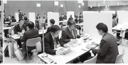
企業の人手不足解消や学生の地元定着などへの取り組みを推進。昨年11月の「地元企業と大学等の就職情報交換会」には、企業95社と、大学、専門学校など41校が参加した。今年は規模を拡大して開催予定。