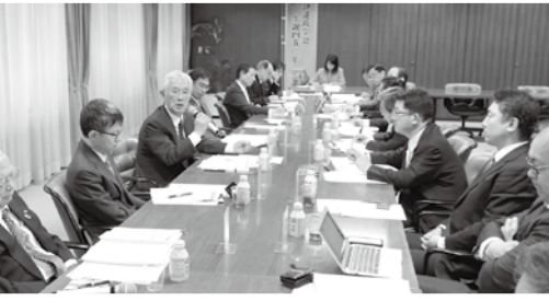
事業計画策定のため昨年11月から12月にかけて計10回にわたり開催した議員懇談会の様子。企業活力、地域力、組織力を強化するため各業界の課題を踏まえながら多様な意見を集約していく。