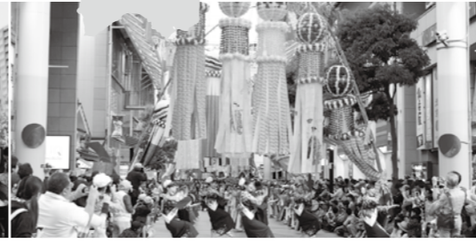
東北六魂祭が東北六県を一巡したことで、昨年、東北絆まつりとして仙台から再スタート。今年は6月2日、3日に盛岡市で開催する。こうした催しなども活用しながら東北を一体的にPRしていく。