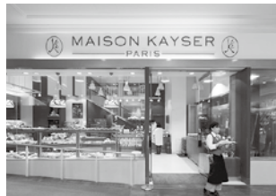
泉パークタウンピオの清潔感ある店舗。焼きたてのパンの香りがお店の外まで漂い食欲をそそる。

をお客さまと共に。メゾンカイザーでしか味わえないパンを、これからもお届けしたいと思