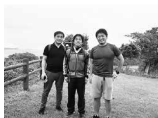
県の観光施策「宮城オルレ」による訪日客誘致に向け、実際にトレッキングコースを歩き商品企画を行う鄭氏(写真中央)。

弊社では、県が整備中の観光トレッキング「宮城オルレ」をはじめ、鳴子温泉など地域が持つ観光資源を再編集し、「健康」を付加価値とする旅行商品を企画・販売しています。事業活動はまだ小さいですが、観光の未来を作ることが真の復興につながる信じ、地域の皆さんと一緒に、全身全霊でまい進して参ります。