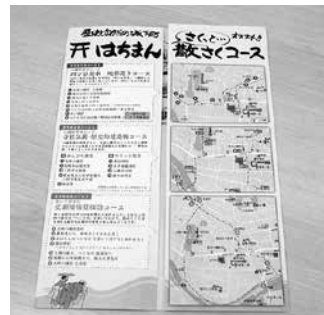
東北文化学園大学と協力して作成した地域マップ「八幡町まちあるき」。個性あふれるお店のほか地域の歴史的建造物などを巡るおすすめの見学コースも掲載。

活動の一つとして、メンバー間での親睦を深めることや、地域住民の方々からさまざまな声を集めることで新たなチャレンジにつなげるという目的から、毎月1回「ファンミーティング」と呼ばれる会議を地区内の飲食店で行っています。このミーティングがきっかけで、昨年、15年ぶりに大崎八幡宮での盆踊り大会を実施したり、七夕まつりでは当商店街として初めて仕掛物を掲出したりと、活動の幅は徐々に広がってきています。今後とも積極的に意見を集めて実行することで、地域活性化につなげていきたいですね。