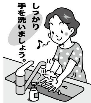
〔千田内科／青葉区荒巻〕

ウイルスは嘔吐物と便中に排せつされることから、嘔吐物の処理過程で2次感染することが多く、おなかですくない、吐き気がする、おなかの重い、発熱、頭痛などで胃腸炎が疑われるときには、嘔吐しないように無理に食べず、こまめに水分を摂取し、おなかを休めること、トイレを清潔に使用し、手洗いをしっかりとすることが大切です。トイレ回り、ドアノブ、蛇口などは薄めた次亜塩素酸ナトリウムで拭き掃除することをお勧めします。他人への集団感染を防ぐため、無理に会社・学校へ出向いて嘔吐することのないようにしてください。食べ物を口にするときには、必ず手を洗うことを習慣づけましょう。