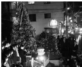
12月に開催される「むにゃむにゃバンブー クリスマス」の様子。点灯式での地元中学・高 等学校の合唱部による歌声は、毎年多くの 人々を魅了している。

今後も、これまで積み上げてきた地域 住民や近隣商店街等との信頼関係を大切 にしなが、訪れた方々に常に喜んでい ただけるよう、魅力的なまちづくりにメン バー一丸となって取り組んでいきます。