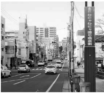
商店街のメインストリートである連坊通りには、 洋菓子店や飲食店などのさまざまなお店が軒を 連ねる。季節に合わせたむにゃむにゃくんの衣 装も見どころの一つ。

現在の「むにゃむにゃ通り」という名 称が付いたのは、1998年5月からで す。地域情報を集めながら発信してい