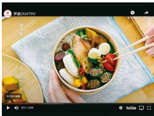
藤崎「伊達CRAFT」の実際のバーチャル店舗。商品にカーソルを合わせると下図のようにその商品の紹介動画が流れる。