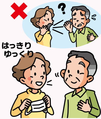
〔草刈耳鼻科／宮城野区原町〕

の仕組みや私たちの態度です。まずは普段の話し方。加齢性の難聴は単に音が小さく聞こえるだけでなく、音声にゆがみが生じ不明瞭になります。大きな強い音声はかえってよく聞き取れません。お話しするときはマスクを外して顔を見ながら、ゆっくりはっきり静かな声で話す方がよく聞こえます。また、社会の設備にも注意が必要です。駅や車内のアナウンス、エレベーターの重量オーバーアラーム、ATMの緊急連絡電話など、社会は難聴者にとってのバリアーであふれています。そのため、なるべく文字や絵の情報を交えることが大切です。最近ではIT技術を使った、話し声を明瞭にする機器もありますので活用するのも良いでしょう。