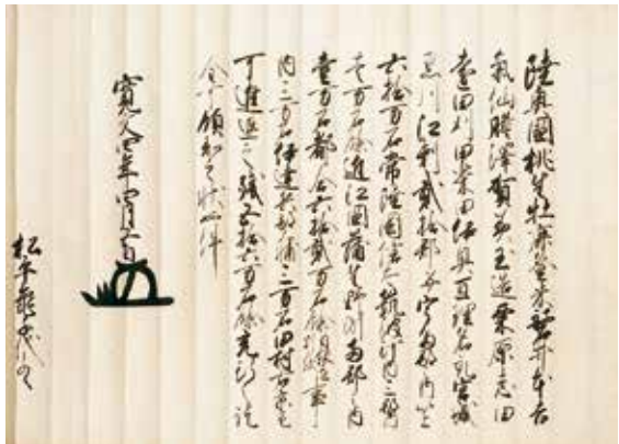
徳川家綱領知判物 仙台市博物館蔵 幕府が亀千代に与えた仙台藩領62万石から3万石ずつを後見人に分けることが記されている。

そうしたなか、幕府から仙台藩に派遣されていた国目付を仙台城で供応する行事での席次をめぐる問題が発生します。役職と家格の順であった席次が無視され、着座という家格で三番目に来るべき古内重定と伊東重門の席次が、目付や奉行原田の嫡子よりも後ろにされました。家格は当時の武士にとつて重要な秩序であり、それを無視されたことは屈辱的なことでした。これに対し、親族の伊東重孝らが行事を差配した奉行らを激しく批判。その後伊東重孝・重門は宗勝の暗殺計画を立てたとして厳しい処分が下されます。こうした藩内の不和や混乱はその後も続いていきます。